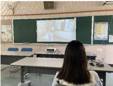
相談会前に VR キャンパスツアー